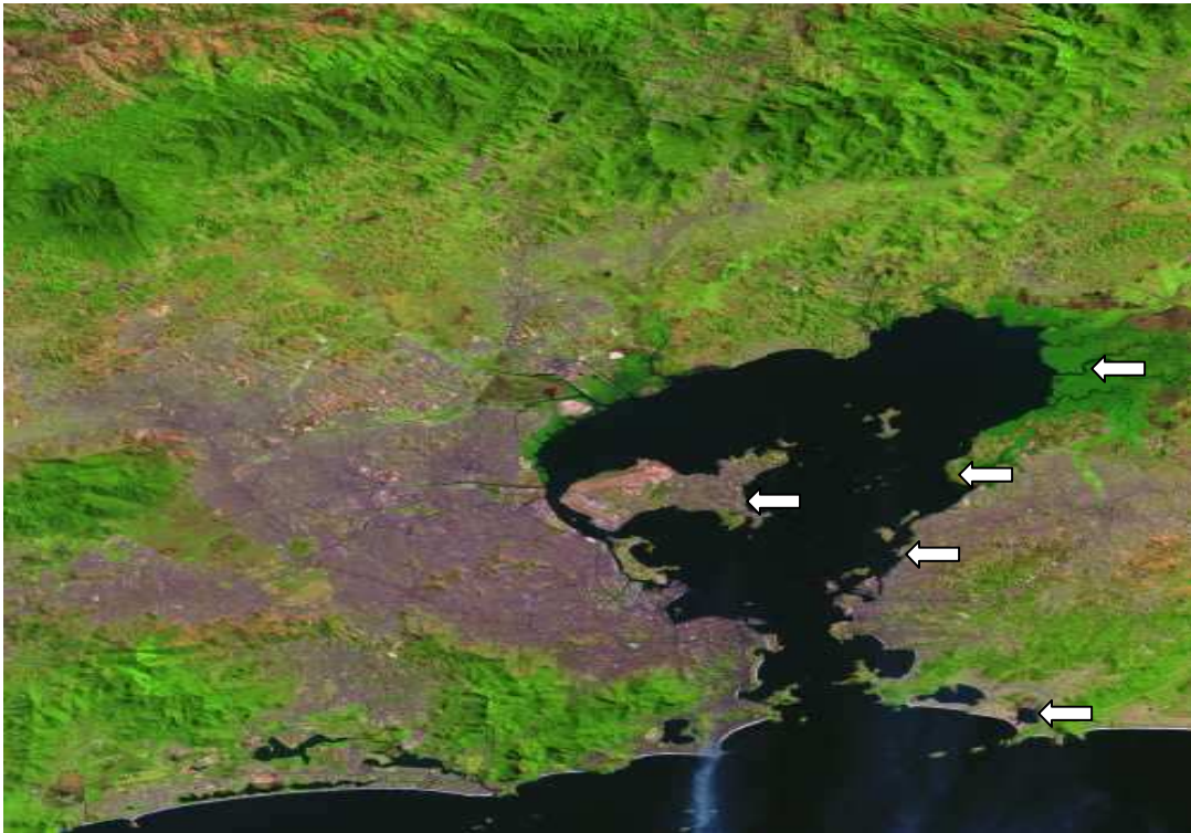
Figura 2 – Baía de Guanabara – ocupação humana (foto de satélite)