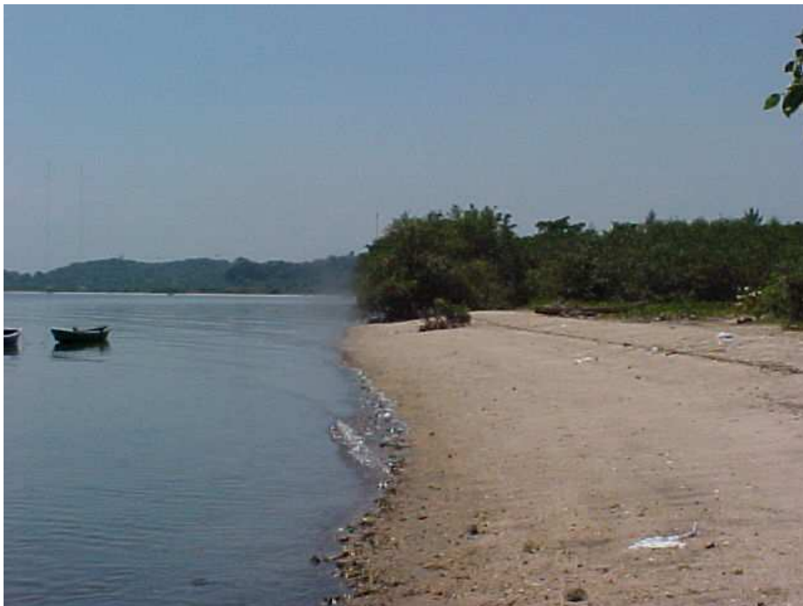
Figura 5 – Foto do Manguezal na Praia da Luz – São Gonçalo/RJ