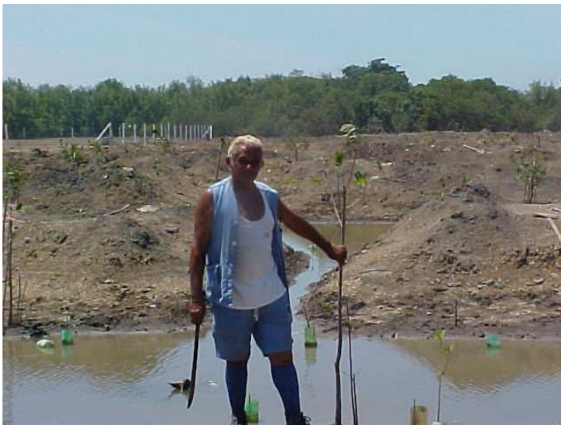
Figura 3 – Foto do Plantio de Mangue da Fundação Onda Azul em Mauá – Magé/RJ