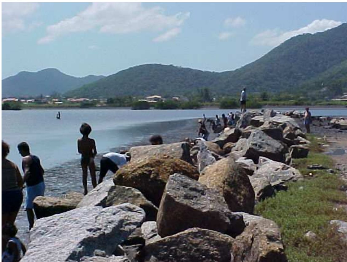
Figura 6 – Foto do Plantio de Mangue da APREC com Voluntários na Lagoa de Itaipu – Niterói/RJ

Em entrevista com Dioné Marinho, Secretária de Estado de Meio Ambiente -SEMADS, coordenadora executiva do PDBG – Programa de Despoluição da Baía de Guanabara - a partir de julho de 2001, ela descreveu a nova concepção do PDBG apresentada ao BID, afirmando que todos os componentes anteriores do projeto estavam muito fragmentados.